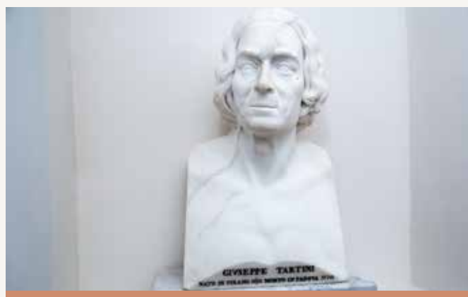
Doprni kip Giuseppeja Tartinija v njegovi spominski sobi