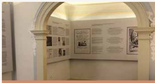
Muzejska pot po Tartinijevi hiši

Projekt se je formalno zaključil, a blagovna znamka je nekaj, kar se konstantno gradi in nikoli ne zaključí. In mi gradimo naprej, skupaj z vami, dragi bralci. Vse in še veliko več o projektu si preberite na naslovu www.discovertartini.eu .