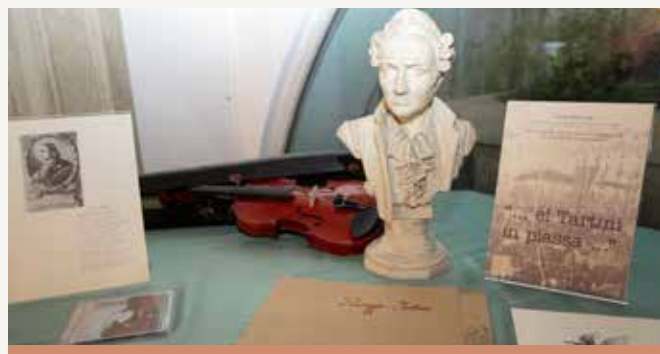
La sala delle Vedute, Casa Tartini

A 250 anni dalla morte resta ancora molto da scoprire dell'eredità musicale, culturale e scientifica di Giuseppe Tartini. Il grande violinista fu un personaggio di spicco del mondo Europeo settecentesco e il suo nome non venne dimenticato nei secoli successivi, come quello di altri compositori italiani (si veda il caso di Vivaldi). A dispetto della fama, però, uno studio sistematico della sua produzione e soprattutto una valorizzazione rispettosa della sua opera compositiva sul fronte editoriale ed esecutivo sono oggi ancora lacunosi.