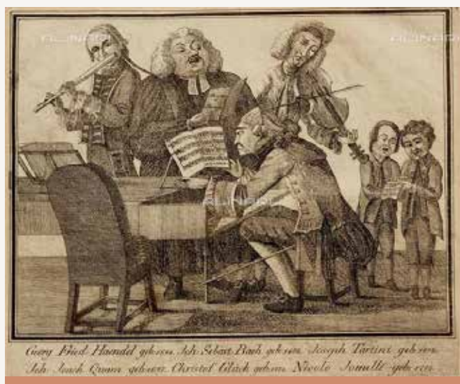
Aquarello e inchiostro su carta, anonimo, collezione privata