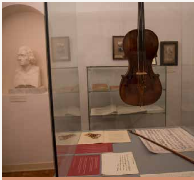
Stanza ricordo, Casa Tartini, NF

Nel 1728, all'età di trentasei anni, Tartini iniziò a dedicarsi anche all'insegnamento, attività che gli valse l'epiteto di "maestro delle Nazioni" impegnato all'interno di quella che prese il nome di "scuola delle Nazioni". Si trattava di una realtà di primo piano nel contesto della cultura musicale settecentesca, che formò future figure musicali di prim'ordine. Da tale scuola uscì anche Giulio Meneghini, il suo allievo prediletto, che avrebbe sostituito quindi ricoperto il posto di primo violino nella cappella musicale del Santo.