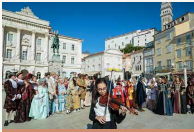
Mlada violinistka igra na Tartinijevem trgu

A Tartini ni bil znan samo kot izjemen učitelj, temveč tudi kot velik humanist. Odnos s študenti je pogosto prerasel v prijateljstvo ali očetovsko zaščito, kar je mogoče razbrati tudi iz biografije enega najbolj znanih učencev priljubljenega učitelja, Johanna Gottlieba Naumanna, ki je po študiju