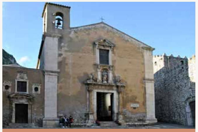
Cerkev sv. Katarine Aleksandrijske