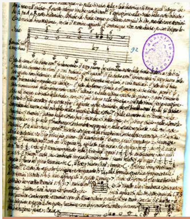
Osmi list iz zvezka z naslovom »Terzo« [tretji] z glasbenimi in matematičnimi razpravami o diatonični lestvici in krogu [SI PAK PI 334, t. e. 3, a. e. 140].