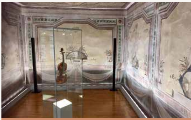
Tartinijeva hiša, avtor: Olga Izquierdo Sotorrio

Tartinijeva hiša ima sicer prav zanimivo zgodbo. Leta 1983 so jo namreč razglasili za kulturni spomenik, in ko so leto kasneje začeli z deli, je bilo, kot bi odprli Pandorino skrinjico. Po odstranitvi ometa so se na presenečenje vseh prikazale dvorane s stenski poslikavami. Danes so obnovljene in na ogled je osrednja Sala delle vedute, Sala dei capricci, Sala delle stagioni, Sala dei padiglioni in Sala dei fiori. V hiši je sedež Skupnosti Italijanov, namenjena pa je kulturnim prireditvam, razstavam in različnim umetniškim delavnicam.