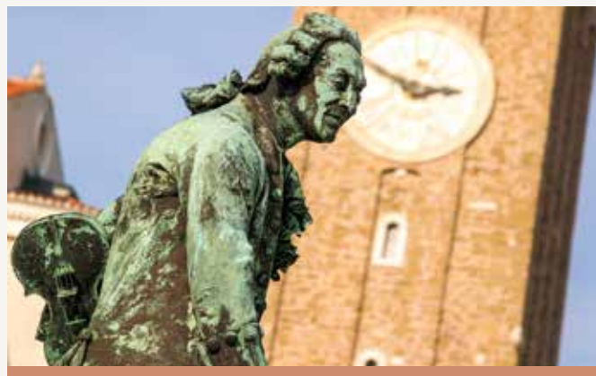
Il monumento di Tartini, NF

Per concludere la storia degli anni di Tartini a Pirano, possiamo fermarci sulla piazza centrale della città e ricordare la solenne cerimonia in occasione dell'inaugurazione del monumento a Tartini, quando resero omaggio al loro illustre concittadino almeno quattromila persone.