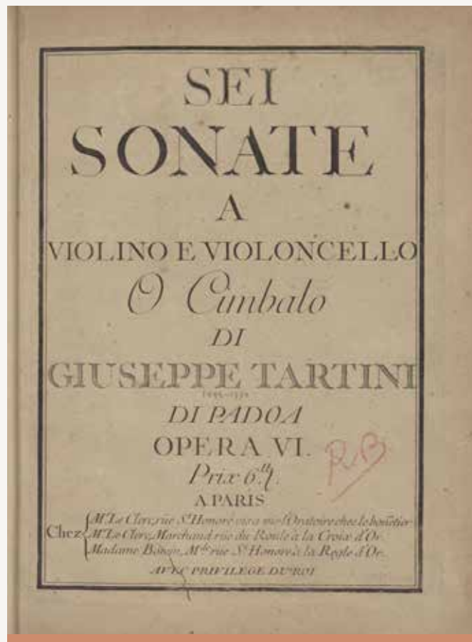
Publicazione con le sonate di Tartini, Discover Tartini

Padova fu una destinazione obbligata per molti pellegrini a causa di Tartini, poiché molti vennero proprio per ascoltare