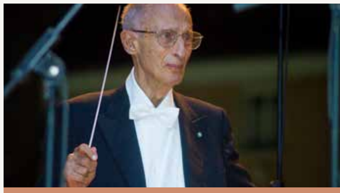
Nedavno preminuli legendarni dirigent orkestra I solisti veneti, Claudio Scimone na nastopu v Piranu

V zbirki L'Art du violon iz leta 1798 je Jean Baptiste Cartier posebej izpostavil sonato v g-molu z naslovom Vražji trilček, predstavljena je kot delo za sladokusce in izjemnega pomena. Ob tem je njena vrhunska lepota obrobna, v ospredju je namreč njena priljubljenost zaradi povezovanja s čarobnimi dogodki, ki je zagotovila, da se je skozi celotno 19. stoletje ohranil vsaj drobec Tartinijevega ustvarjanja.