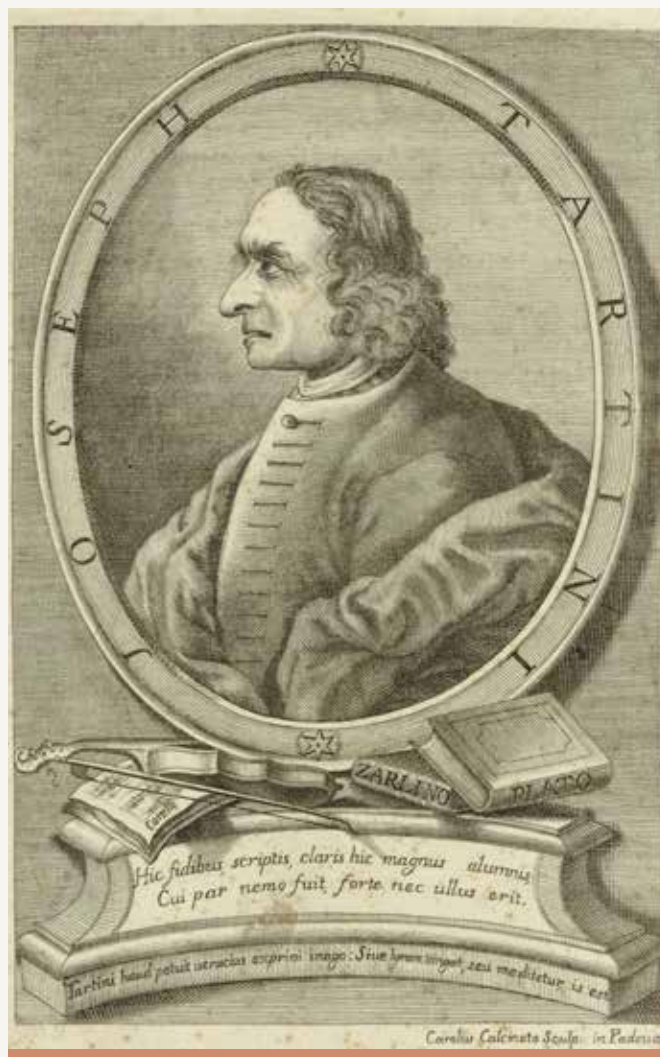
Tartinijev portret

Padova je bila priljubljen cilj številnih romarjev tudi zaradi Tartinija, saj so mnogi prišli prav zato, da bi prisluhnili njegovi glasbi, ki je bila cenjena tudi drugod po Evropi. Poznali so jo predvsem v Franciji, objavljali so jo na Nizozemskem in v Angliji.