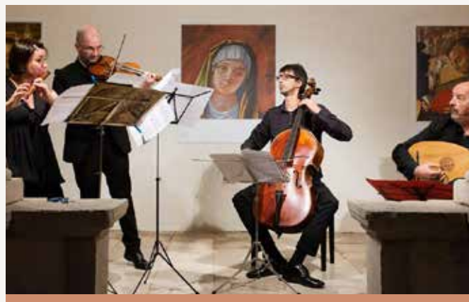
L'Orchestra Il terzo suono