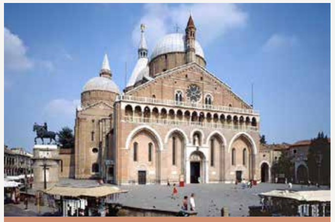
Bazilika sv. Antona

Instrumentalna glasba se je skoraj čarobno podila okrog stebrov bazilike in se razpršila po prostoru, in kot je zapisal Durante, je Tartinijeva violina "govorila" vsem romarjem, ki so obiskali svetišče, ne glede na njihov jezik in poreklo.