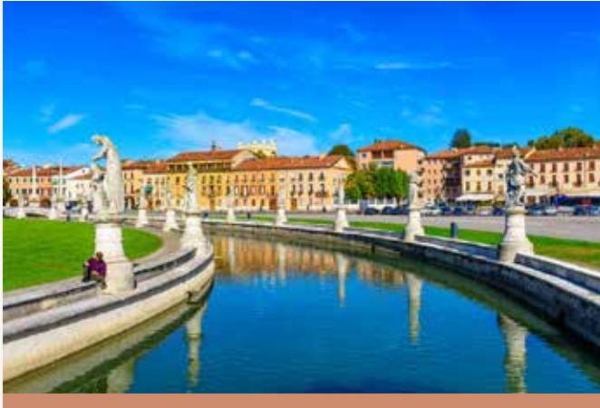
Prato della Valle, vir: Discover Tartini

Njegova upodobitev je zelo domišljajska, saj poteze niti malo ne spominjajo na ikonografijo, ki je na voljo. Glasbenik stoji in se z levo roko naslanja na doprsko podobo Francesca Antonia Vallottija, kapelskega mojstra, s katerim sta s skupnimi močmi ustvarila razkošen glasbeni sestav, zaradi katerega je padovanska ustanova postala znana po vsej Evropi.