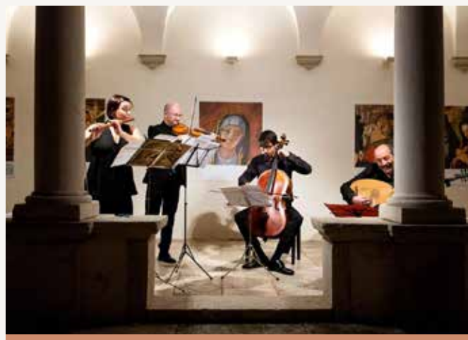
Festivalni ansambel Il terzo suono