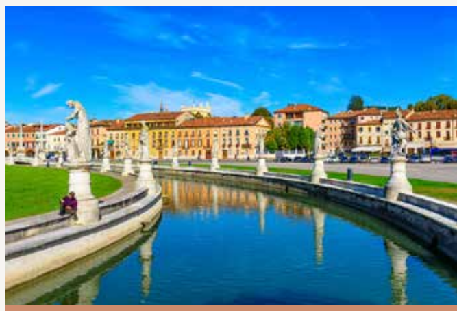
Prato Della Valle: Discover Tartini

Prato della Valle è la piazza principale di Padova e una delle più grandi d'Europa. L'ampio spazio ingloba un parco di forma ellittica e in due file parallele lungo il canale, sono stati disposti i monumenti di personaggi che avevano vissuto a Padova. Il numero 29 contrassegna la statua dedicata a Tartini e collocata qui nel 1803 (oppure nel 1806). Il musicista è raffigurato in piedi e con la mano sinistra appoggiata al busto di Francesco Antonio Vallotti, maestro di cappella, con il quale avevano creato un vasto repertorio musicale, rendendo l'istituzione padovana nota in tutto Europa.