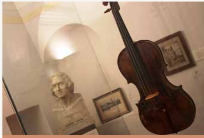
Il violino di Tartini

Con la seconda guerra mondiale alle porte, il violino di Tartini e la sua maschera mortuaria, assieme ad alcuni preziosi documenti e oggetti di valore storico-culturale, furono per protezione nascosti: il materiale venne murato sotto la scalinata del Municipio. Nel 1947 nelle due casse rinvenute, "ritrovarono"