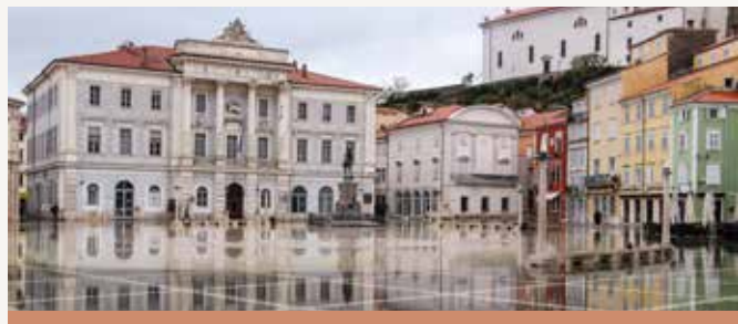
Piazza Tartini, NF

Giuseppe Tartini è nato nel 1692 a Pirano in una famiglia nobile, nel 1708 si spostò a Padova, per studiare legge e teologia. Gli archivi che parlano della famiglia Tartini non permettono di scoprire i dettagli della gioventù di Giuseppe in Istria, ma appare chiaro che lasciò in lui profonde tracce. Come rilevato da Durante, nella vita quotidiana di Tartini era presente la musica popolare istriana, ricca di forme e stili, di cui troviamo traccia nei suoi lavori di ricerca nel suo periodo maturo. Inoltre, in base alle sue importanti decisioni, partendo da quella di abbandonare la nativa Pirano, è possibile intravedere la sua ferma opposizione alla famiglia, che aveva per lui altri progetti. Naturalmente apprese nozioni di arte e violino anche dai frati, ma altre fonti fanno comprendere che era interessato di più alle arti cavalleresche, soprattutto la scherma.