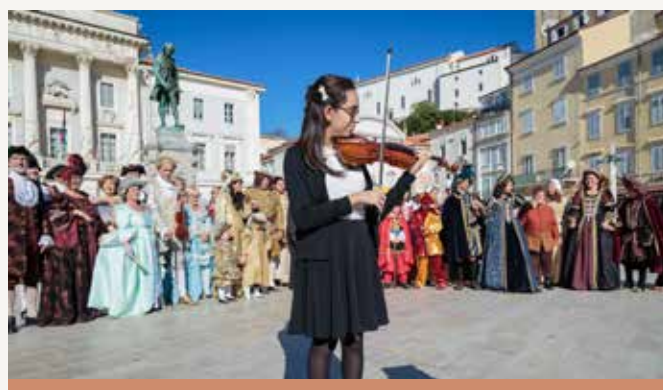
Una giovane violinista sulla Piazza Tartini