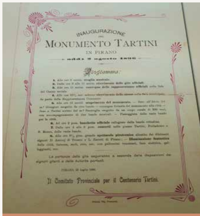
Inaugurazione di monumento Tartini