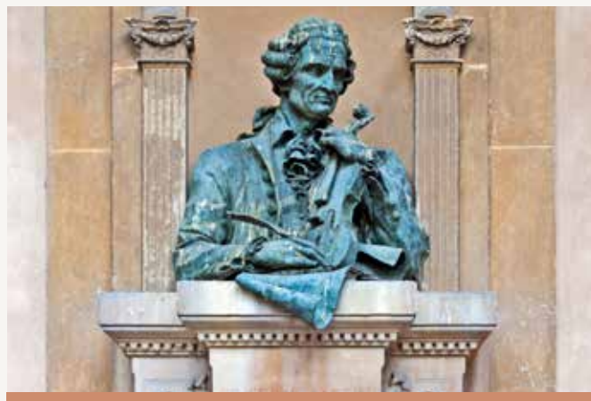
Statua di Tartini sulla Basila di Sant'Antonio

La musica strumentale s'innalzava quasi magicamente attorno alle colonne della basilica e si spandeva nello spazio e, come scritto da Durante, il violino di Tartini» parlava «a tutti i pellegrini, che visitavano il luogo di culto, indipendentemente dalla loro lingua e dalla loro origine.