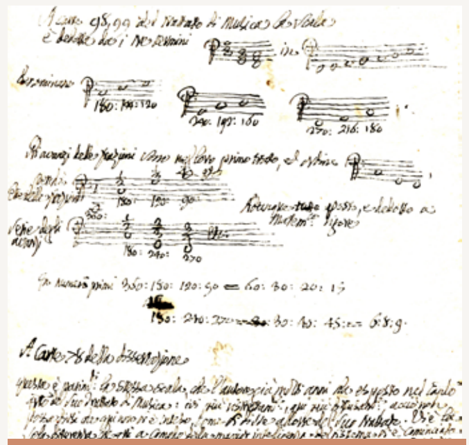
Scritti di teoria musicale, scale e vari conti (SI PAK PI 334, t. e. 3, a. e. 145).

Tartini era in contatto con la congregazione dell'oratorio sin dalla giovane età. Come scrisse Durante nella sua biografia, sembra quindi naturale che continuasse a visitare i monaci a Padova. D'altra parte vi sono prove scritte dei suoi contatti con la Chiesa di San Tommaso. Sono conservate due lettere indirizzate a padre Giovanni Battista Martini, forse il più grande musicologo del diciottesimo secolo, con il quale aveva una relazione stretta.