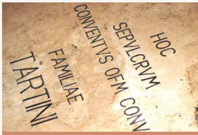
La tomba della famiglia Tartini, Chiesa di San Francesco