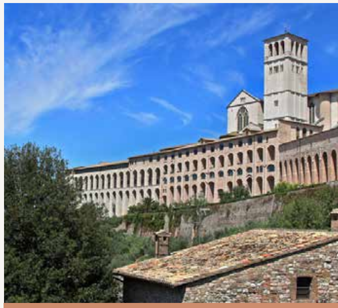
Giuseppe se je zatekel v Assisi