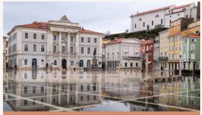
Tartinijev trg Piran