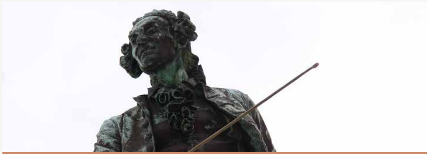
Monumento di Tartini, NF

Se l'Istria ispirata da Tartini ottiene la sua aureola di capitale, il mondo della cultura può diventare più ricco. Ovviamente, gli organizzatori e i selezionatori devono capire che non si tratta soltanto di un anno di "spettacoli e divertimento".