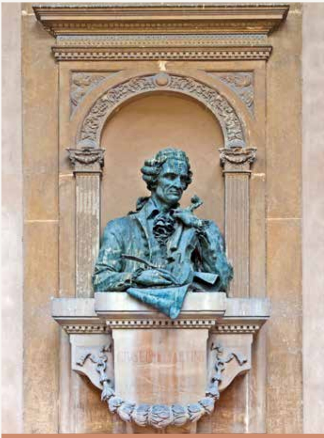
Tartinijev kip na baziliki sv. Antona