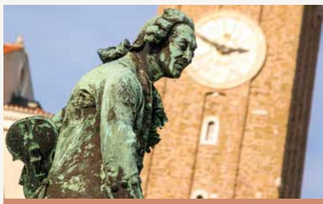
Tartinijev spomenik