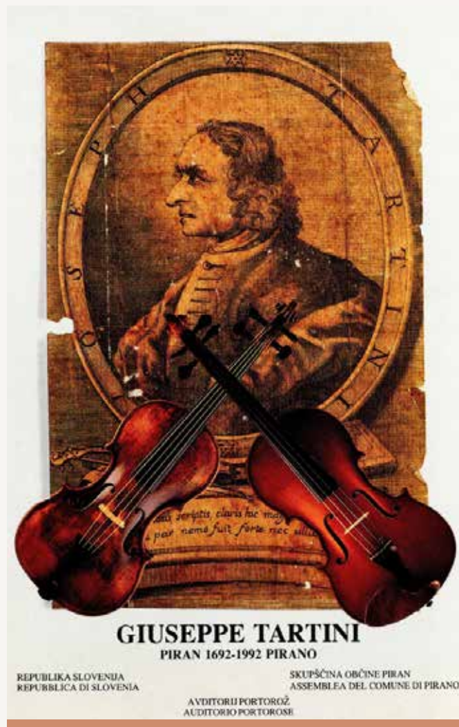
Portret Giuseppeja Tartinija