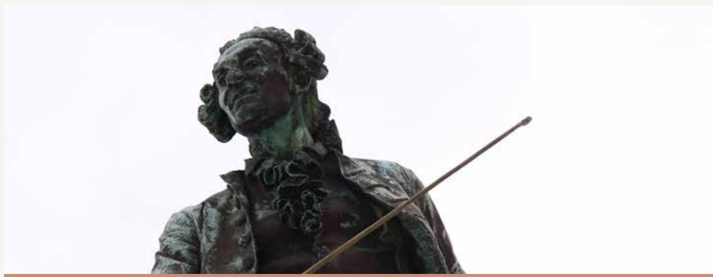
Tartinijev spomenik, Avtor: NF

Če bo prestolniško avreolo dobila s Tartinijem navdihnjena Istra, lahko kulturni svet postane bogatejši. Seveda morajo organizatorji in selektorji razumeti, da ne gre le za eno leto »nastopov in zabave.«