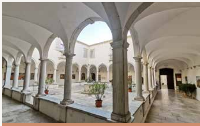
Križni hodnik minoritskega samostana Piran

Od rojstne hiše pot z odtisi Tartinijevih stopinj vodi do dveh objektov, ki ju raziskovalci omenjajo kot morebiten kraj, kjer je bil mladi Giuseppe deležen prvih učnih izkušenj. Prvi je Mediadem Pyrhani, kjer se je nekoč nahajala cerkev sv. Filipa, v njej pa je delovala bratovščina sv. Filipa Nerija. In ravno v oratoriju Filipa Nerija naj bi po novejših biografskih raziskavah Tartini naredil prve korake na svoji poti k izobrazbi. Drugi kraj, ki se zelo pogosto omenja kot skladatelj prvi učni hram, pa je minoritski samostan, saj je bila v tistem času Frančiškanom zaupana pomembna vloga na področju kulture in izobraževanja.