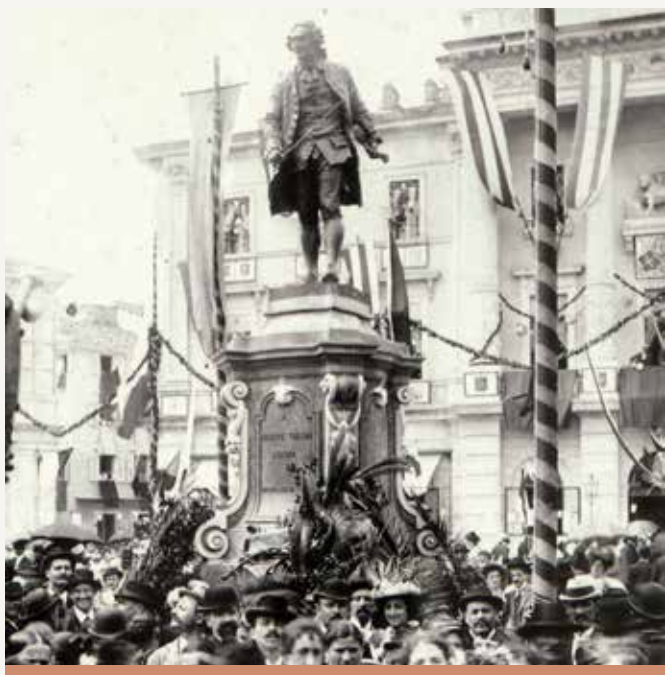
Odkritje spomenika Giuseppeja Tartinija