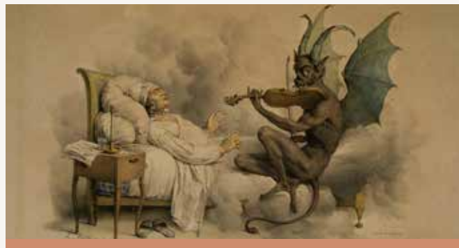
La scena del famoso sogno