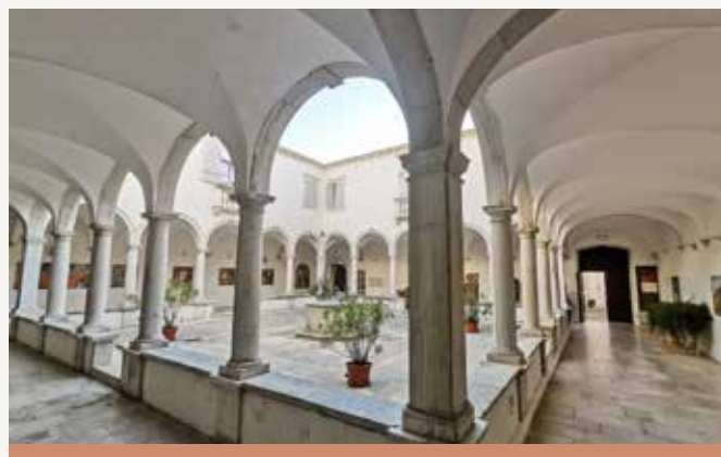
Chiostro del convento dei padri minoriti, NF

Dalla casa natale le orme di Tartini ci conducono a due edifici, che secondo i ricercatori potrebbero aver dato al giovane Giuseppe le basi della sua preparazione. Il primo è il Mediadom Pyrhani, dove una volta sorgeva la chiesa di San Filippo e nella quale operava la confraternita di San Filippo Neri. E proprio all'oratorio Filippo Neri, in base ai nuovi dati biografici, Tartini mosse i primi passi sul cammino dell'istruzione. L'altra sede, indicata spesso come primo tempio del sapere per il compositore, è il Convento dei Minoriti, poiché all'epoca ai Francescani era demandato un importante ruolo nel settore della cultura e dell'istruzione.