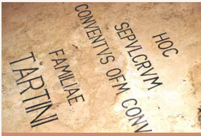
Grobnica Tartinijevih v cerkvi sv. Frančiška v Piranu