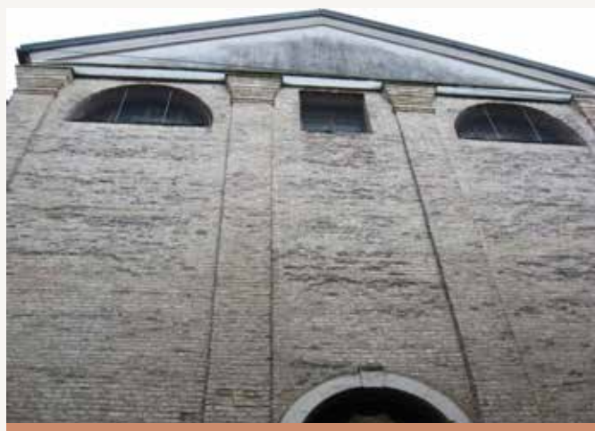
Cerkev San Tomaso Becket

Velja za enega baročnih draguljev mesta. Postavili so jo v sedemnajstem stoletju na obstoječih temeljih, do leta 1890 pa so v njej delovali posvetni duhovniki kongregacije sv. Filippa Nerija.