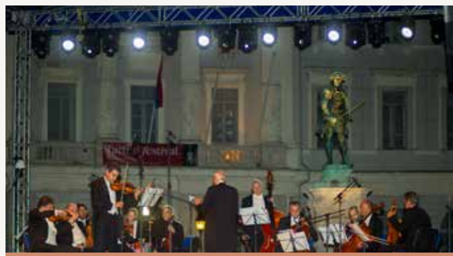
I solisti veneti in concerto a Pirano, NF