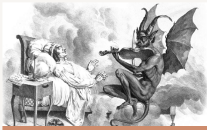
Podoba znamenitih Tartinijevih sanj